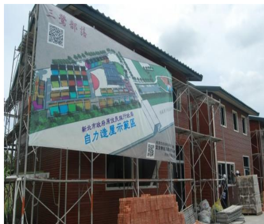
新北市三峽原住民族文化園區自力造屋

市政府為協助三鶯河濱原住民族部落重建，擬定三峽原住民族文化園區工程計畫，扶助 42 戶原住民家戶將近 200 人搬遷到合法安全的社會住宅，於民國 100 年度由三峽區公所編列「三峽區三鶯原住民族部落居住環境」3 年期中程計畫預算 5,000 萬元，另於民國 102 年 11 月獲原住民族委員會核定補助 3,880 萬元，總工程經費合計 8,880 萬元，辦理期程自民國 100 年 10 月至民國 103 年 12 月。惟計畫執行因新聚落搬遷、建築用地之國有土地相關申租作業及原住民自力造屋工程尚未完成等，將計畫期程調整變更至民國 106 年 10 月 30 日，較原預定進度落後近 3 年。另園區基地達 3.42 公頃，配置家屋區(42 戶)約 1.7 公頃(含家屋、公共設施及綠地、道路)、農耕區約 1.6 公頃(含停車場、農耕作業、緩衝綠帶、生態水池及溝渠等)，其中劃設農耕作業面積 0.49 公頃，惟尚無後續種植耕作具體執行計畫；又園區占地面積達 3.42 公頃，亦無原住民族部落特色文化展演規劃，以帶動該區原住民族部落文化觀光，或其他能促成原住民族生活自立自足計畫等。鑑於三峽原住民族文化園區是全國首例都會型原住民聚落重建示範案例，經函請積極研謀改