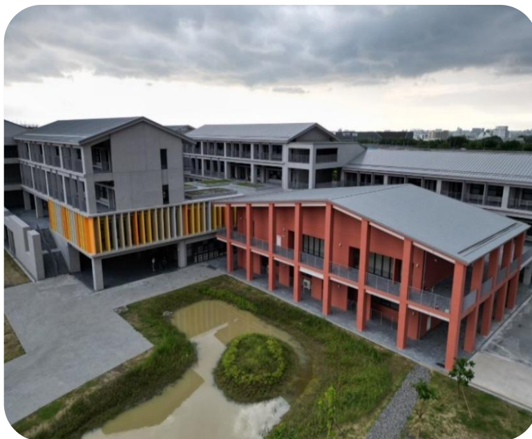
臺南市立沙崙國民中學轉型為K(幼兒園)至12年級 具特色雙語教學示範學校新建工程

事，經函請檢討改善。 據復：(一) 已補足相關專業工程技術士人數，爾後將技術士設置規定及罰則納入契約； (二) 已要求承商將技術士資訊列載於施工計畫書，並重新送核； (三) 已責成承商於技術士出工表簽章；(四) 爾後注意填報期程。