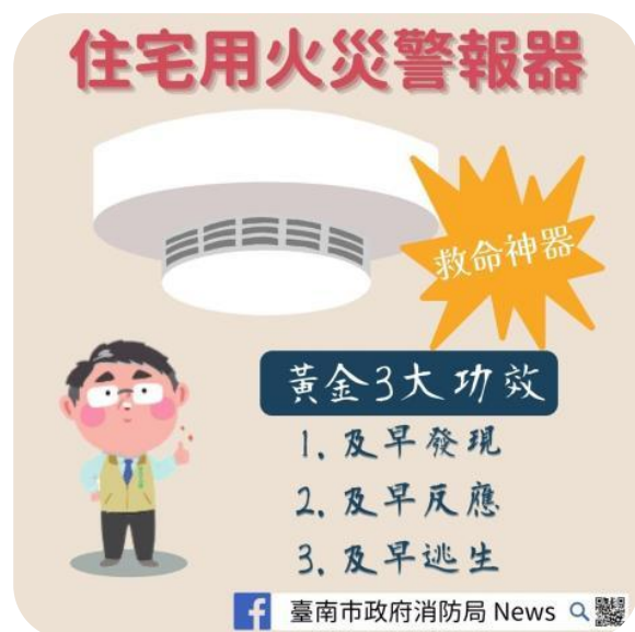
住宅用火災警報器

臺南市政府為有效控管未立案宗教場所，輔導其正常發展及維護公共安全，訂有臺南市未立案宗教場所清查作業要點，113年度轄內未立案宗教場所清查結果，計有 1,358 處，其中近 6 成（806 處）未立案宗教場所屬住宅式宮廟。經查其業務執行情形，核有：（一）區公所每年訪查未立案宗教場所並函報列管清冊，惟部分清查作業未臻確實，且該府辦理宗教業務考核項目，評分方式過於簡略，未能評核清查作業落實程度；（二）未定期提供住宅式宮廟清冊予消防局，不利其落實住宅用火災警報器之推廣，有待檢討改進，以維護公共安全，及加強宣導防火等各項輔導措施，建議參採桃園市、新竹縣、屏東縣將定期提供未立案宗教場所清冊予消防局之規定納入宗教場所輔導要點等情事，經函請檢討改善。據復：（一）將函請各區公所辦理未立案宗教