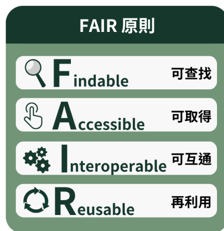
圖 4 研究數據開放 FAIR 原則

查，國科會於臺灣 AI 行動計畫 2.0 主政科研領域之資料治理與流通，藉由「回應重要挑戰之 AI 研究計畫」徵求醫療與健康、半導體與製造、環境、智慧城市、服