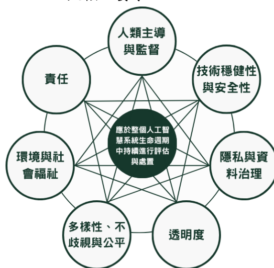
圖 3 歐盟執委會可信賴人工智慧七大核心要求

5. 政府推動 AI 治理，允宜參考國際組織開發可信賴 AI 評估清單與事件報告框架之作法，研議建立 AI 事件資料庫、整合可信賴 AI 檢核工具，以促進 AI 風險識別並完善可信賴 AI 發展環境：歐洲聯盟執行委員會（European Commission，下稱歐盟執委會）發布「可信賴人工智慧評估清單（ALTAI）」，係由獨立 AI 專家小組制定之自我評估工具，旨在協助組織開發、部署或使用 AI 系統，並評估其 AI 系統是否符合七大核心要求（圖 3）。另隨著 AI 應用普及，如何因應 AI 事件亦為各方關切議題，美國麻省理工學院（Massachusetts Institute of Technology, MIT）系統化整理與分析 AI 潛在風險，匯集成「AI 風險儲存庫」，已收錄 1,600 餘項風險資料，供利害關係人瞭解與管理 AI 衍生之危害，OECD 亦發布「AI 事件通報共通框架」，提供各國採用一套共通且可按各自國內政策及法律調整之方法，協助政策制定者由已識別 AI 事件中汲取經驗，進而發展安全、可靠及可信賴之 AI。可信賴 AI 係指人工智慧系統在生命週期各階段遵守一系列倫理原則及技術要求，經查，人工智慧基本法（草案）已擬訂我國 AI 研究與應用之倫理原則，於完成立法前，國科會、數位發展部、數產署等機關已將倫理準則，各自轉化為具體可操作之評估表及檢核清單，惟分別僅適用於「回應國家重要挑戰之 AI 研究計畫」之 16 組團隊、AI 產業實戰應用人才淬煉計畫之業者、公部門。次查，自 112 年 8 月起，行政院責成各部會就主管業務涉及 AI 議題，蒐集研析國內外規範及相關資料，據以辦理相關法規調適作業，惟各部會尚無一致性分析框架，無法有效整合與共享跨領域資訊。經函請行政院參考 OECD、MIT 之作法，研議建立國內外 AI 事件資料庫，供各界瞭解 AI 相關之風險；暨參考國際組織所訂定之可信賴 AI 評估清單，結合我國人工智慧基本法（草案）之核心倫理原則，綜整國科會、數位發展部、數產署已訂定之評估表或檢核清單，建立適合我國可信賴 AI 發