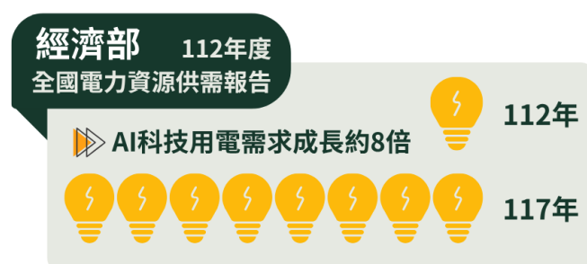
圖 2 AI 科技用電需求示意

Agency, IEA) 「能源與人工智慧 (Energy and AI)」國際會議提出第一項原則為「沒有能源就沒有 AI，特別是電力 (There is no AI without energy – specifically electricity)。」政府需為 AI、資料中心和數位基礎設施提供穩定電力，並確保資料中心和 AI 有助於電力部門安全轉型，及加強與利害關係人之溝通，又未來電力需求將大幅增加，對電網造成壓力，宜預為因應。經查，國網中心高效能運算主機 111 至 113 年度算力值合計分別為 21.64 PFlops、25.64 PFlops、45.47 PFlops，同期使用電力分別為 998 萬餘度、1,119 萬餘度、1,617 萬餘度，顯示隨著算力持續成長，用電需求亦呈現逐年上升趨勢。另中央研究院、行政院及所屬 114 及 115 年度預計編列 74 億餘元增建 210 PFlops 算力，國科會亦規劃透過「晶片驅動臺灣產業創新方案」及「大南方新矽谷推動方案」建置高速效能運算主機，預計 118 年算力建置目標為 480 PFlops，為該會 113 年算力值之 10 倍；至私部門部分，國際大廠微軟、輝達及民間企業日月光、鴻海等均已宣布在我國建置資料中心或規劃相關投資。次據經濟部「112 年度全國電力資源供需報告」揭示，AI 科技用電需求預估至 117 年約增加 200 萬瓩，較 112 年成長約 8 倍 (圖 2)，其後在 AI 穩定應用趨勢下，預估 113 至 122 年全國電力需求年均成長率約為 2.8%，需要新機組、電網 (變電所) 更新與儲能系統之建設，以確保供電穩定、滿足用電需求。又台灣電力公司 113 年 8 月對外說明，為兼顧電力系統穩定與安全，已管制資料中心之用電計畫，引導高科技產業往中南部發展，避免桃園以北電網負載過度。鑑於數位服務和 AI 快速發展，公私部門持續投資建置高效能運算主機及資料中心，其電力需求與集中布建所衍生之區域供電壓力，經函請行政院研議建立相關產官學研之跨部門溝通機制，取得能源供需平衡，確保電力足以供應 AI 及數位基礎設施發展需求。【詳總決算審核報告第 2 冊丙、貳、行政院主管項下重要審核意見 (十六) 4.】